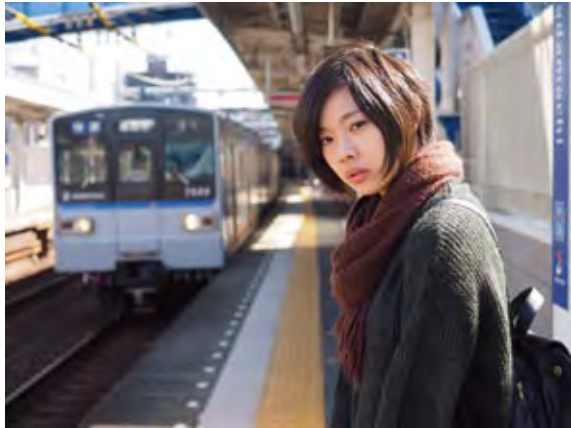
作品タイトル：相鉄線を待つ女(ヒト) 2016年

PHOTO YOKOHAMA参考サイト: http://photoyokohama.com/event/entry-363/